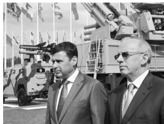
На международном военно-техническом форуме «Армия-2017»

Серьёзные преобразования ожидают ещё одно проблемное предприятие области — рыбинский завод «Раскат». Возрождением завода дорожной техники займётся НПО «Высокоточные комплексы», входящая в структуру госкорпорации «Ростех». По соглашению, которое глава региона и руководство компании подписали на международном военно-техническом форуме «Армия-2017», в рыбинское предприятие будет инвестировано 500 млн рублей. Это позволит модернизировать и расширить производство. Предприятие, кроме дорожных катков, будет выпускать грейдеры, телескопические погрузчики и другие виды техники. Число работников завода увеличится вдвое — до 600 человек.