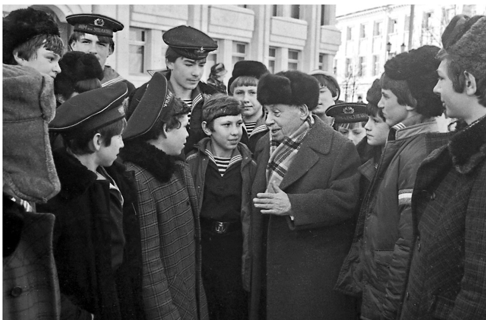
Иван Дмитриевич Папанин с ярославскими мальчишками на Советской площади.

Продолжением конференции стали экскурсии. Журналисты посетили дом-музей И.Д. Папанина; дом-музей Н.А. Морозова, в комнатах которого сохраняется обстановка последних лет жизни выдающегося ученого-энциклопедиста, а рядом находится парк в английском стиле с живописным прудом; музей-аквариум, расположенный в Ихтиологическом корпусе; прогулялись по Борку – уникальному ярославскому наукограду.