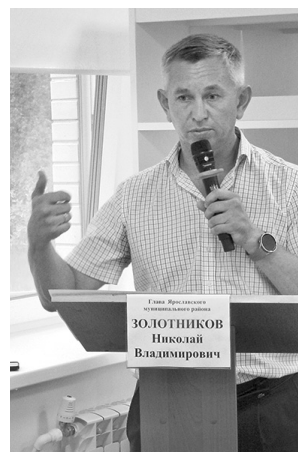
Глава ЯМР Николай Золотников

В Красном Бору только что построили обще-