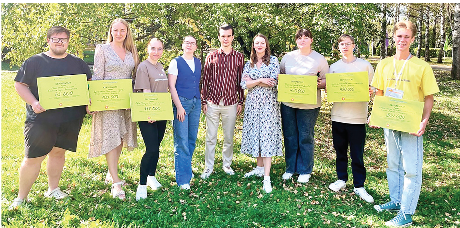
Победители грантового конкурса

Благодаря широким возможностям грантовой площадки «Росмолодежь. Гранты» представители молодежи Ярославского муниципального района на форуме «Максимум» получили солидные гранты на общую